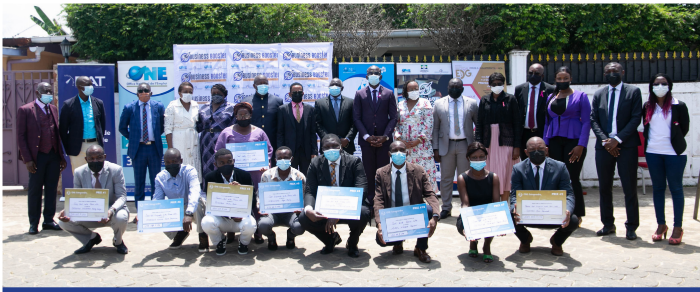
Organisation de la cérémonie officielle de remise de prix aux lauréats du concours Business Booster (plans d'affaires) de la 3 ème édition

L'ONE a organisé en partenariat avec Epargne et Développement du Gabon (EDG), le 27 octobre 2021 à la MAE, la cérémonie des remises des prix aux 10 premiers lauréats de la 3 ème édition du Business Booster en présence des Maires des communes de Libreville, d'Owendo, d'Akanda et des acteurs de l'écosystème entrepreneurial.