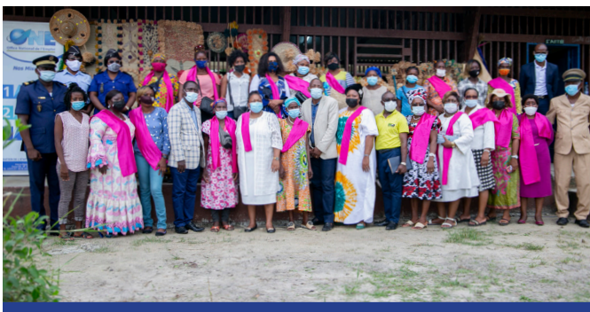
Session de sensibilisation des femmes entrepreneurs de ntoum lors de la 23 ème journée nationale de la femme

Handicapés du Gabon, l'objectif était d'édifier lesdits étudiants sur les prestations de l'ONE et les possibilités d'insertion par l'auto-emploi au travers les différents programmes exécutés par la Maison de l'Auto-Entrepreneur (MAE).