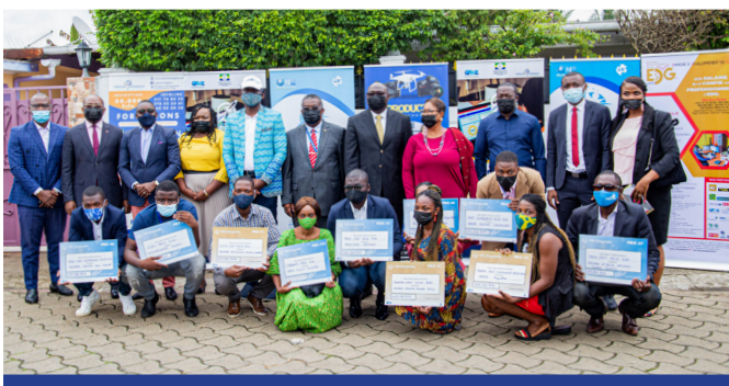
Organisation de la cérémonie officielle de remise de prix aux lauréats du concours Business Booster (plans d'affaires) de la 2 ème Edition

L'objectif de cette rencontre était de renforcer les capacités des femmes intervenant dans l'activité du raphia afin de leur permettre de maîtriser le circuit de valorisation de leurs produits afin de leur donner une visibilité via le numérique.