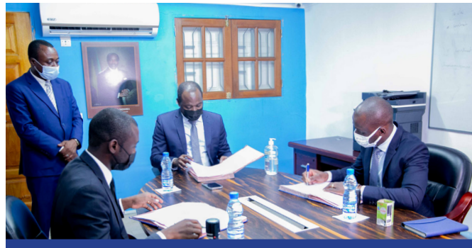
Signature d'une convention de partenariat avec Cyberschool Entrepreneuriat pour la mise à disposition de l'outil « plan d'affaires »

Du 10 au 12 Mai 2021, l'Antenne Régionale du Haut-Ogooué a organisé en partenariat avec l'Agence Nationale de la Formation et de l'Enseignement Professionnel (ANFEP), l'examen de certification de 97 apprentis formés dans le cadre du PRODECE.